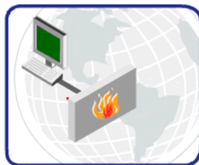
Conectividad Global segura