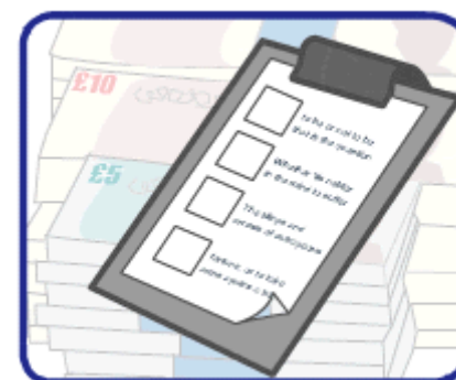
Cumplimiento de la legislación vigente