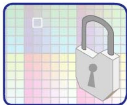
Protección de la marca y activos

Soluciones que aseguran la confidencialidad, la integridad y la disponibilidad de la información en los procesos de negocio.