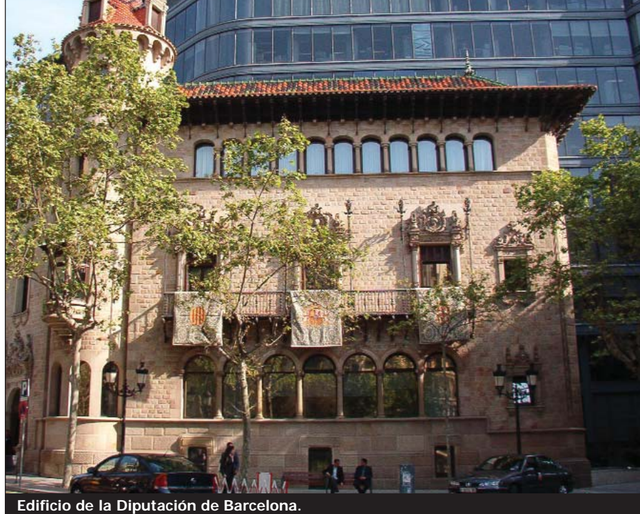
Edificio de la Diputación de Barcelona.

Así pues, la función de la Diputación no sólo se limita a la formalización del tratamiento ante la