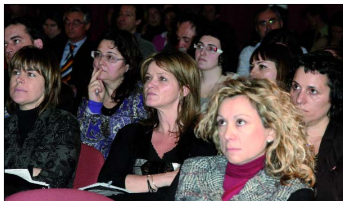
Aspecto parcial de parte del público asistente.