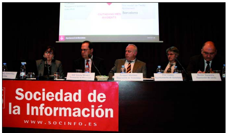
Vista general de la primera (izquierda) y segunda mesas de ponentes.