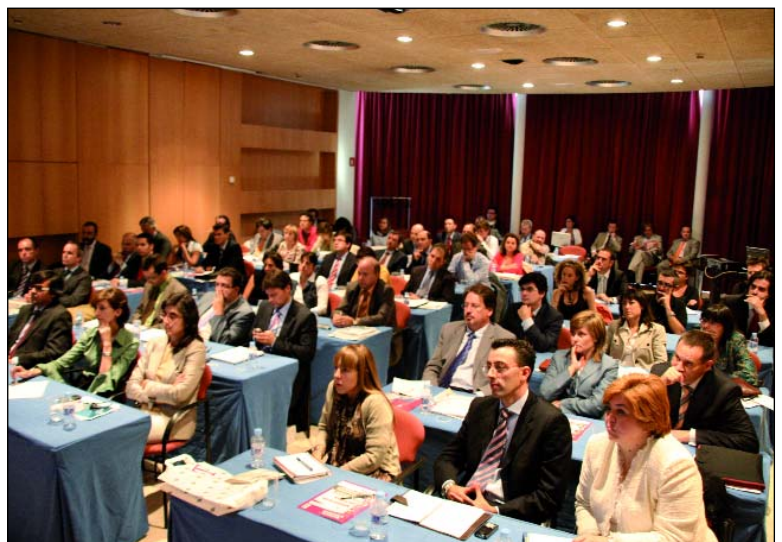
Vista general de la primera mesa de ponentes y aspecto parcial del público asistente.