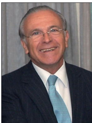
28. La Caixa.