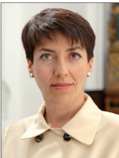
14. Junta de Andalucía.