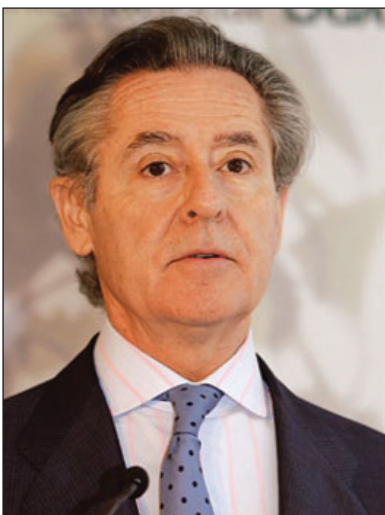
30. Caja Madrid.