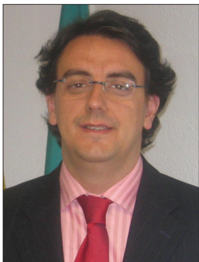
12. Extremadura/ Sanidad.