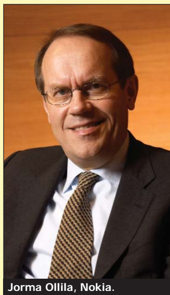
Jorma Ollila, Nokia.