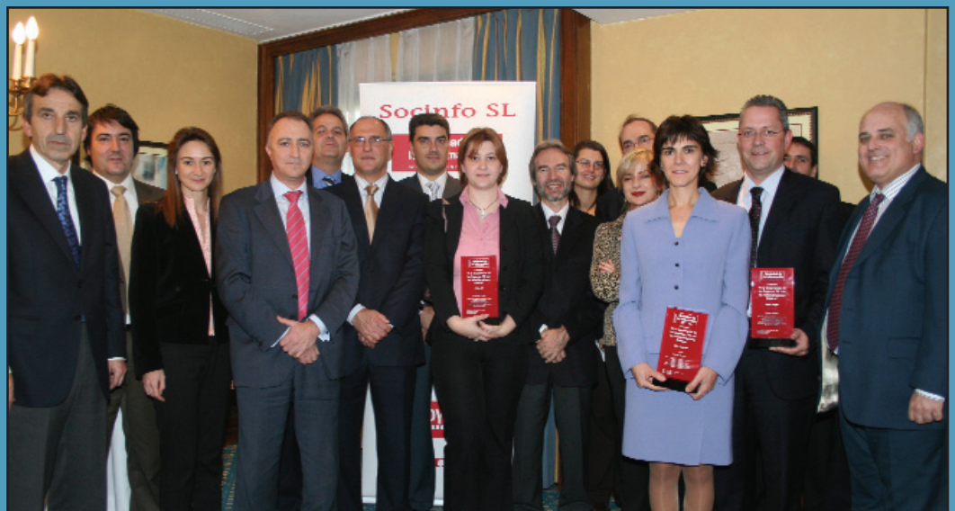
Foto de familia de los representantes de las nueve candidaturas presentadas (tres de ellos con los trofeos obtenidos), y tres de los miembros del Jurado.