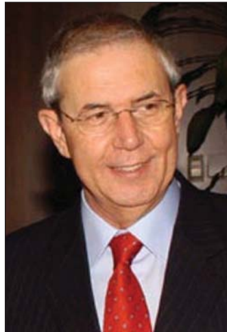
Emilio Pérez Touriño.

de Datos de la Dirección General de la Función Pública señala que "en la actualidad, y a través de la página web oficial de la Xunta de Galicia, www.xunta.es, suministramos información relativa a los siguientes módulos propios de la gestión de recursos humanos":