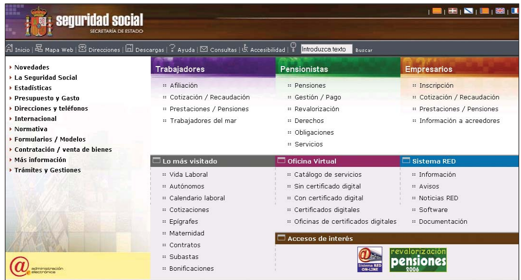
Web de la Seguridad Social.

Actualmente, el SIP, concebido, en un principio, como un sistema para la gestión de personal por parte de los órganos con esta responsabilidad, está en proceso de migración, de forma que se integre en la intranet de la Seguridad Social, con el fin de acercar la gestión al personal que presta sus servicios en la organización y lograr una mayor agilidad en la tramitación