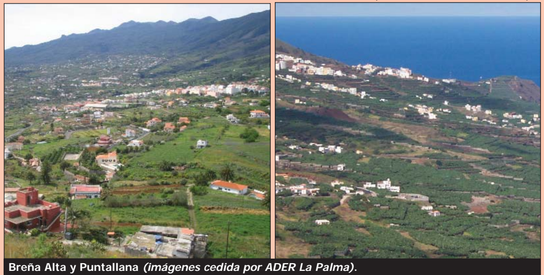
Breña Alta y Puntallana (imágenes cedida por ADER La Palma).

y beneficios de las TIC, así como el fomento de la participación en las actividades. Las actuaciones realizadas han consistido en la organización de un concurso de diseño creativo entre los escolares de toda la isla para el logotipo que lucirá "La Palma Digital". Esta modesta iniciativa ha servido como toma de contacto con la población para su participación en el proyecto.