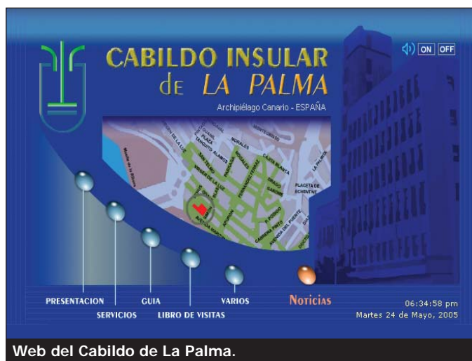
Web del Cabildo de La Palma.

perfil profesional, se ha creado esta herramienta de teletrabajo a través de la Internet sin tener que abandonar su entorno familiar y sociocultural. De este modo, se ayuda a la permanencia de la población y su estabilidad.