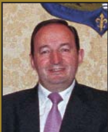
Pedro Sanz Alonso. Gobierno de La Rioja.